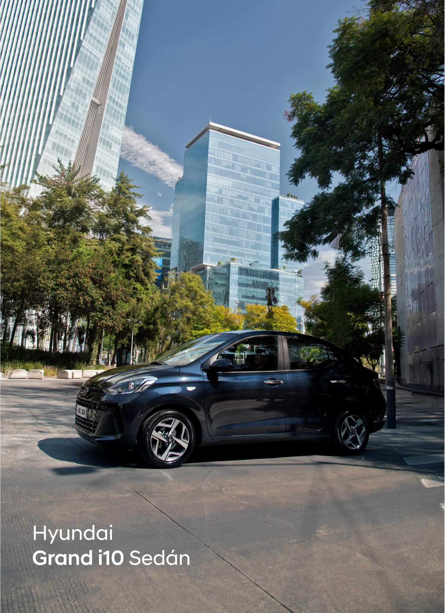
Hyundai Grand i10 Sedán

El contenido de la presente ficha técnica es de uso informativo e ilustrativo. Los elementos e imágenes son de referencia. Hyundai Motor de México, S. de R.L. de C.V. podrá modificar en cualquier momento y sin previo aviso esta información. Consulta disponibilidad, colores, especificaciones técnicas, accesorios incluidos y nivel de equipamiento por modelo en tu Distribuidor Autorizado Hyundai.